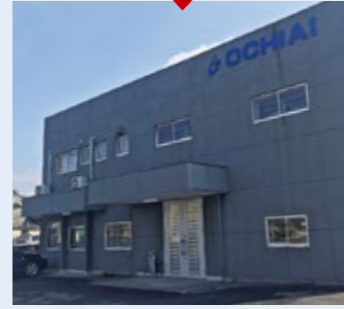
北関東支店 群馬県太田市浜町1-12