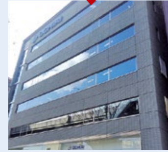
名古屋支店 愛知県名古屋市中川区西日置2-2-4