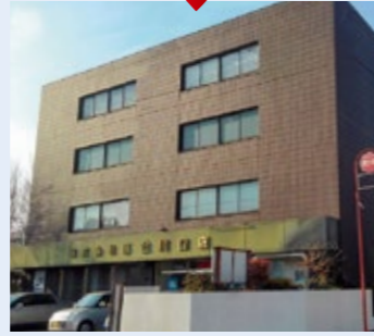
川口支店 埼玉県川口市青木4-25-31