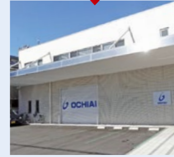
大阪支店 大阪府大阪市鶴見区今津北4-10-15